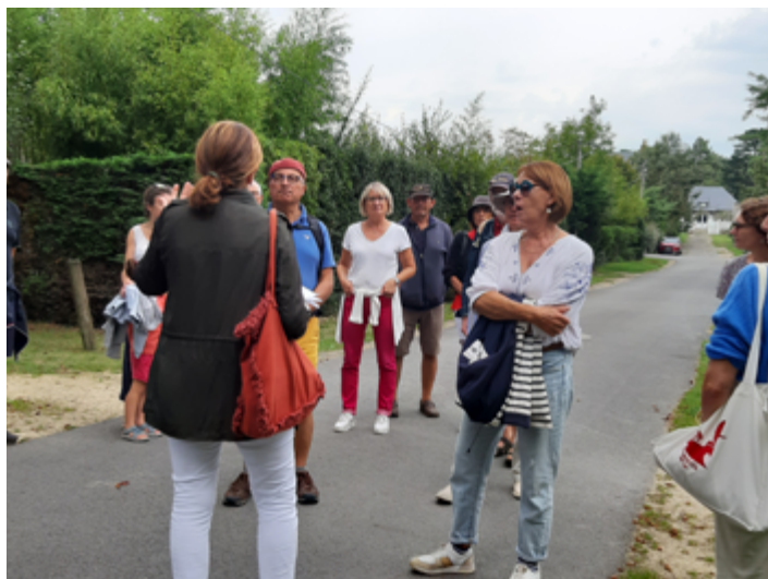
Samedi 16 septembre, Ballade commentée : « Jullouville création ex-nihilo par Armand Jullou » réalisée par l'association « Granville pays de l'estran ».