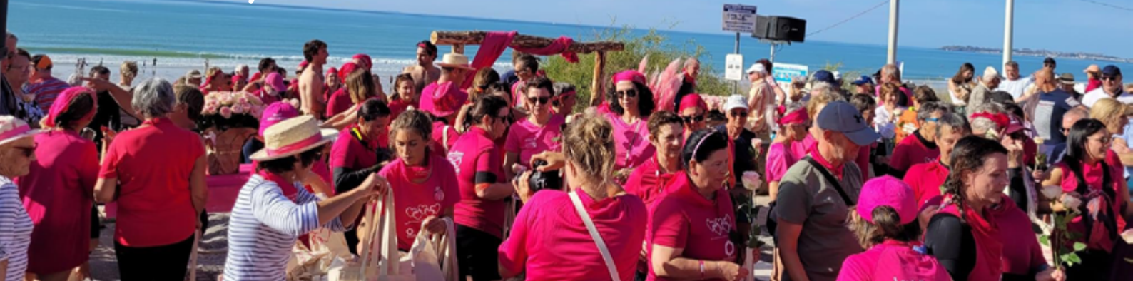
Les 10 ans de l'Association Les Jullouvillaises en faveur de la prévention et la lutte contre le cancer du sein