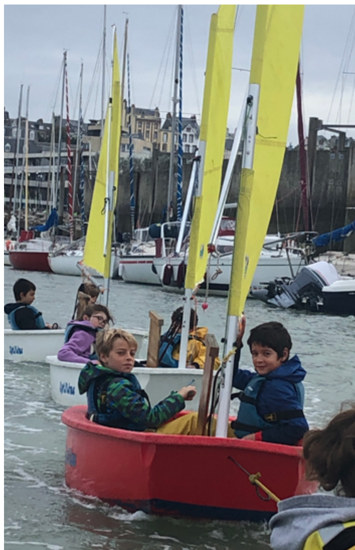
En septembre, projet découverte char à voile et voile avec le CRNG pour les 18 élèves de CM2 : ils ont fait à Jullouville une semaine char à voile et une semaine de voile à Granville