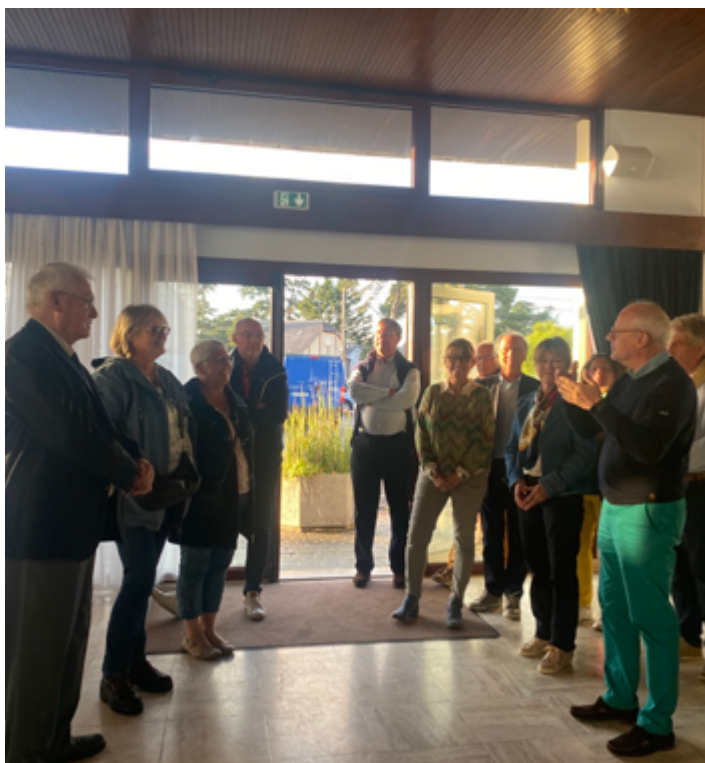
L'accueil des nouveaux habitants de Jullouville s'est déroulé le vendredi 22 septembre à 19 h, en salle du conseil en présence des élus afin de faire connaissance et d'échanger autour d'un verre de l'amitié.