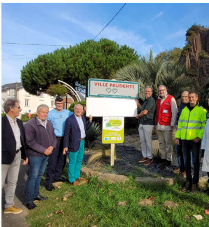
Réception du panneau à l'entrée sud à Edenville le 11 octobre 2023