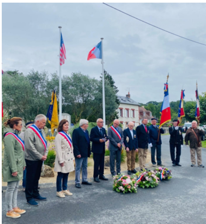
31 juillet 2023 | Commémoration au Rond-point de la Liberté avec les Anciens Combattants et les élus