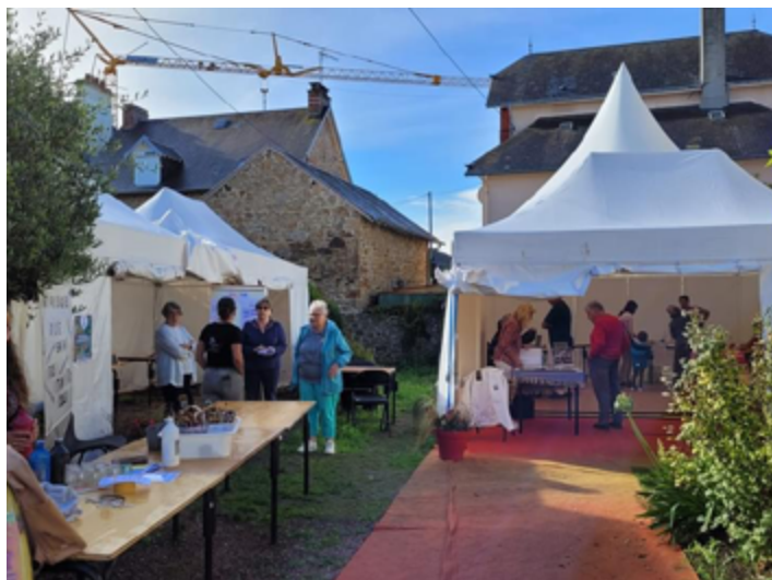
Forum des Associations organisé par la Mairie le 2 septembre 2023