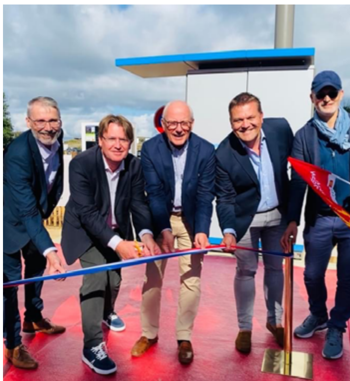
Inauguration de la 1 ère Station de Recharge Rapide pour véhicules électriques rue du Mont Dol le 15 août 2023 par le Maire avec Stations-e et Enedis.