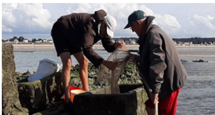
Dimanche 17 septembre, visite des pêcheries par l'association « Estran côté Manche »