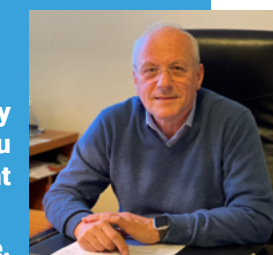
Alain BRIÈRE, Maire de Jullouville - Saint-Michel-des-Loups