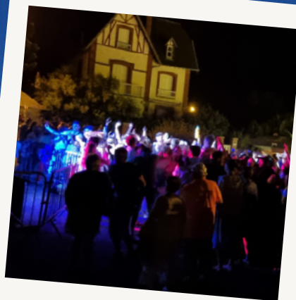
Belle ambiance familiale pour les bals du 14 juillet et du 14 août

Deuxième édition du Salon du livre organisée par la mairie en collaboration avec la Bibliothèque pour Tous