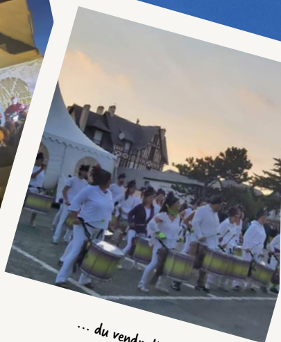
... du vendredi soir