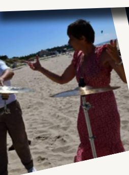
Promenade artistique compagnie Le Dit de l'eau