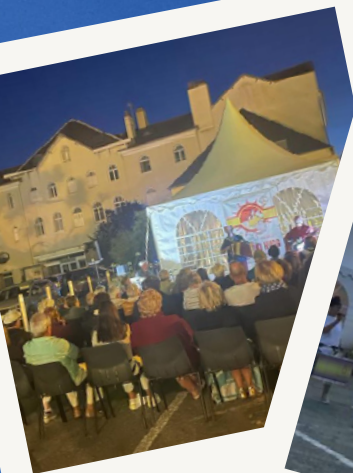
Les concerts ...

La place du Casino : nouveau lieu d'animations et de rencontres