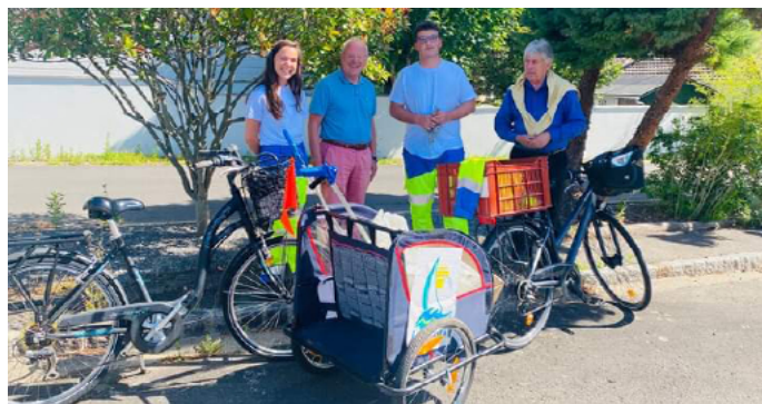
Deux jeunes agents saisonniers ont œuvré tout l'été en renfort des équipes pour la propreté.

Petit bémol : de nombreux déchets (cartons, végétaux, fûts de bière, gros emballages, etc.) ne rentrant pas dans les colonnes de tri sélectif sont abandonnés par leurs propriétaires indécidés sur ces points de collecte au lieu d'être apportés à la déchetterie de Mallouet, pourtant ouverte du lundi au samedi (sauf jours fériés) de 9 h à 12 h et de 14 h à 18 h.