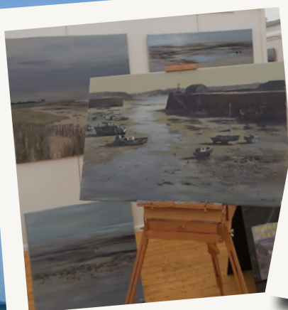
Expositions d'artistes renommés