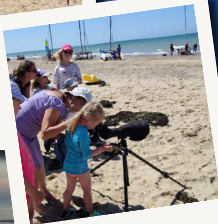
Observation des oiseaux de la plage