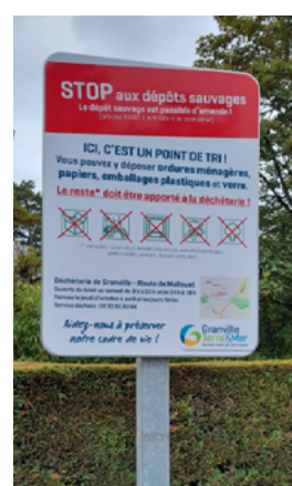
Panneau installé sur l'aire de tri des Grèves

Retrouvez les nombreuses actions de votre Communauté de communes pour réduire les déchets sur granville-terre-mer.fr (rubrique Déchets)