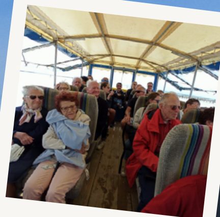
Train marin pour les résidents des Jardins d'Henriette