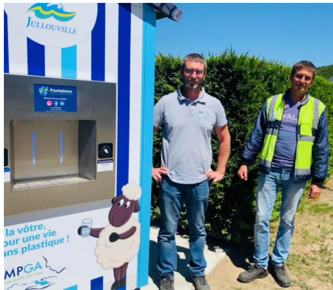
Les agents de la ville et du SMPGA.