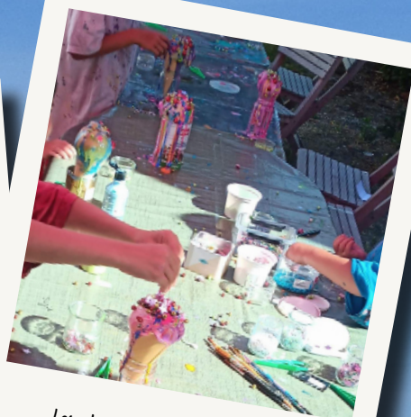
Les ateliers pour artistes en herbe avec Caf Art Naum