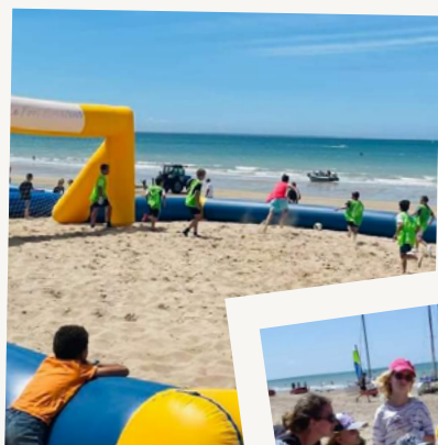
Tournoi Beach Soccer Tour